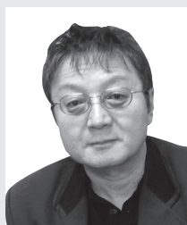
村木 英治 (むらき・えいじ)

1983年にシカゴ大学教育学部の測定、評価と統計解析プログラムにおいて博士号を取得。主な研究分野は計量心理学、教育測定につかわれる技法の開発で、計量心理学では多変量解析や項目応答理論(IRT)に関連した論文、教育測定の分野では国立教育測定(NAEP)についての論文を数多く発表。その他、コンピュータ版テスト分野の論文の発表を行う。また、IRTの応用に必要なコンピュータプログラムを開発し、そのいくつかは教育アセスメントではスタンダードなソフトウェアとして使用されている。